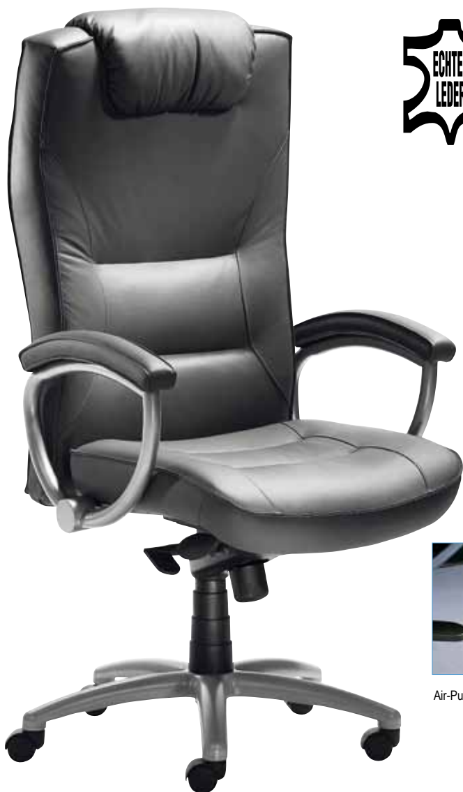
2478 08, 81 014