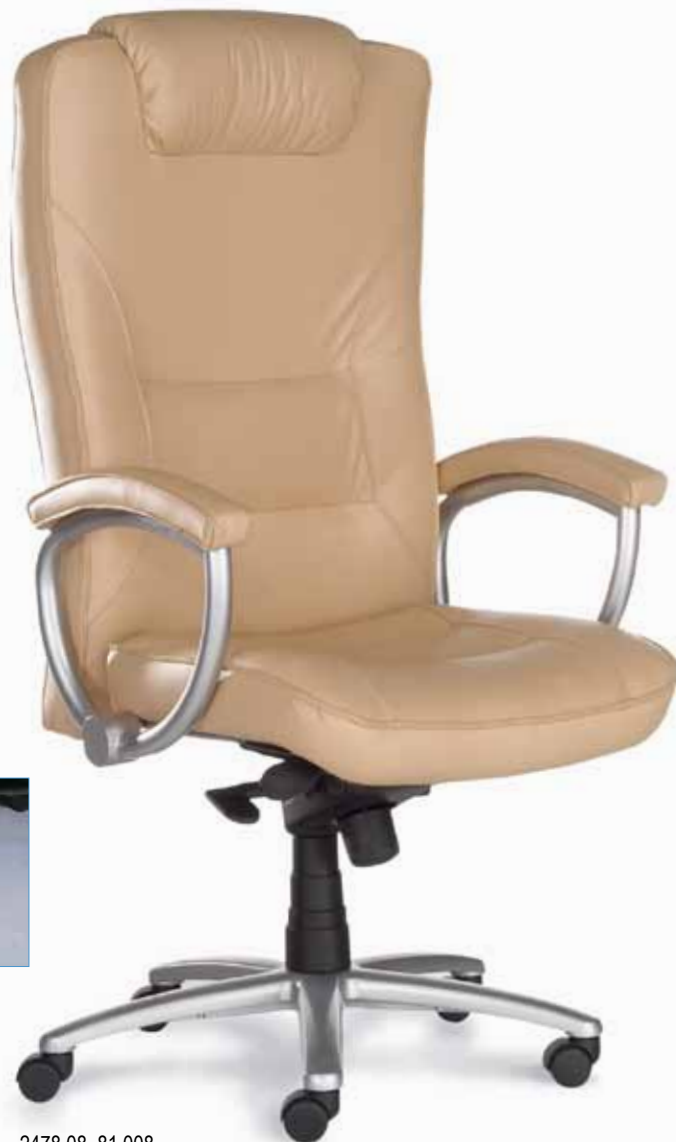
2478 08, 81 008