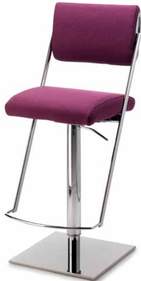
1245 01, 26 360