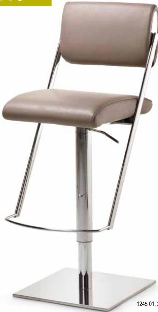
1245 01, 26 466